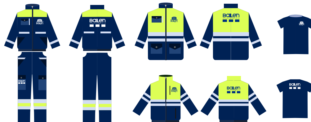
Equipación OBRAS Y SERVICIOS LIMPIEZA VIARIA

En la parte trasera de las prendas se utilizará el logotipo con una dimension no superior a 25 cm medidos en horizontal.